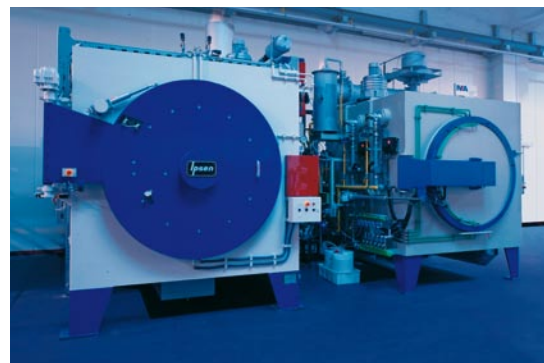
Les anciens (image en haut) et nouveaux fours de nitruration.